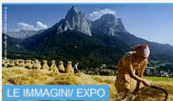
LE IMMAGINI/ EXPO